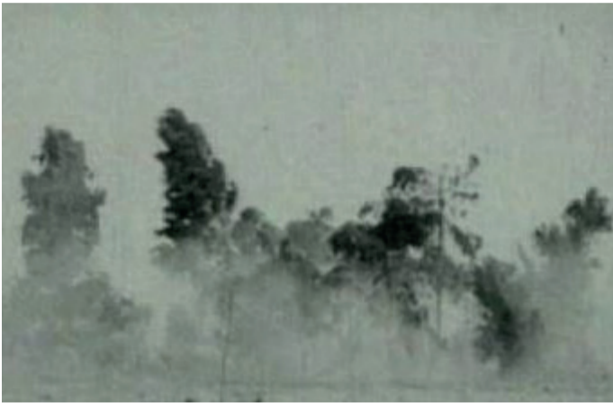
Johan Grimonprez Falling House, 2017 °1962 in Roeselare, woont en werkt in Brussel Interactieve video-installatie

Grimonprez maakte dit werk in situ voor Time Can Tell. Op een groot scherm zien we een zwart-wit landschap waarin van tijd tot tijd, interactief in gang gezet door de passanten, een huis neerstort. Hoewel het duidelijk om een filmbeeld gaat, benadert de schaal van de installatie een realistische grootte waardoor het werk de grenzen tussen fictie en realiteit aftast. Tegelijk refereert de installatie aan de vele promotionele videoschermen die onze publieke ruimte vandaag overspoelen. De technologische evolutie heeft dergelijke technologie niet alleen geperfectioneerd en toegankelijker gemaakt, ze zorgt ook voor een kwalitatieve inflatie van de publieke ruimte. Het billboard met Falling House, door het onverwachte beeld dat ongewild geactiveerd wordt, nodigt de kijker uit om zich op een andere manier te verhouden tot beelden en tot de stedelijke ruimte.