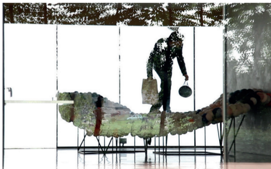
Laat je zalig wegzinken in het LICHTBED in De Vriendschap.

Vrij: van 7u30 tot 13u - zo: van 7u30 tot 12u30