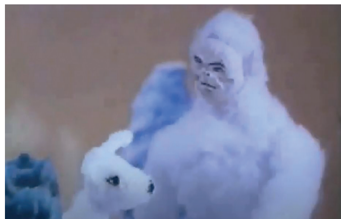
Megan Whitmarsh The life of a Yeti, 2000 °1972, woont en werkt in Los Angeles, VS 16mm film op video, ca. 4'

Door de scènes uit hun oorspronkelijke context te lichten, zijn ze ontdaan van hun oorspronkelijke romantiek en erotiek. Door de snelle opeenvolging van de fragmenten krijg je bovendien het effect dat er na-beelden gemaakt worden: het beeld blijft hangen in je hoofd terwijl het al lang voorbij is en je het terug probeert te voeren naar de oorspronkelijke context.